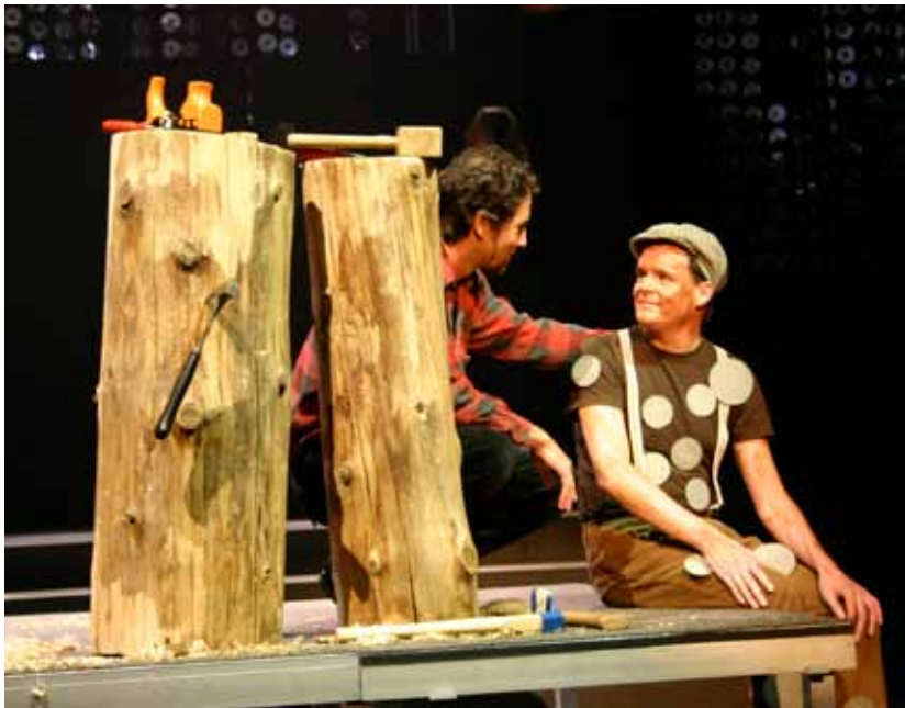
Auf der Bühne, 200x